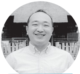
ファシリテーター