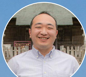
ファシリテーター