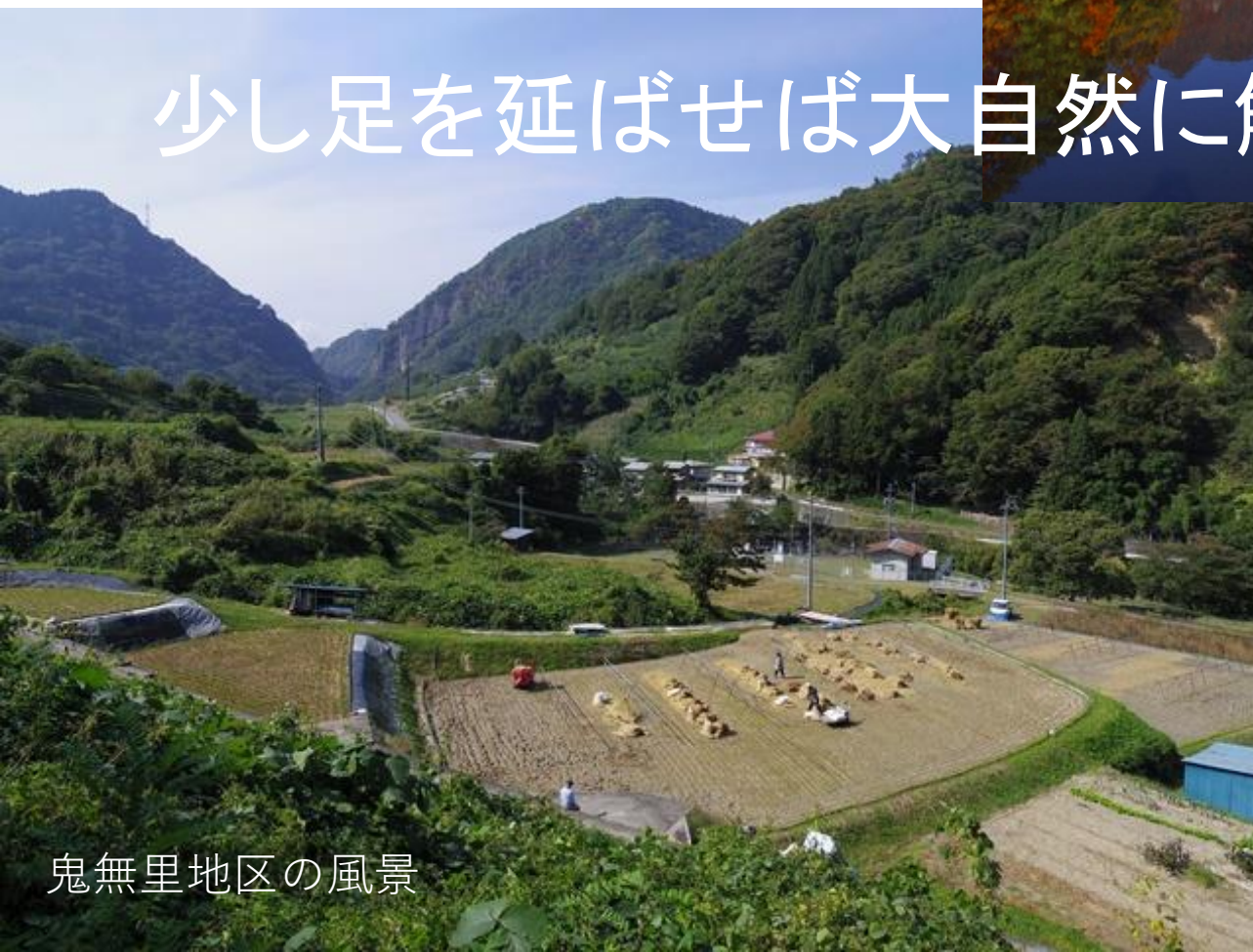
鬼無里地区の風景