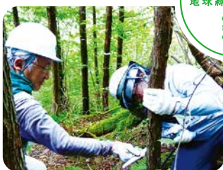
国内森林ボランティア 山と緑の協力隊