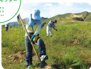
中国での植林活動 緑の親善大使